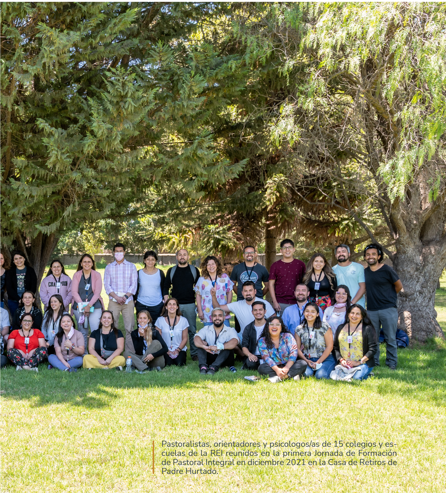
Pastoralistas, orientadores y psicólogos/as de 15 colegios y escuelas de la REI reunidos en la primera Jornada de Formación de Pastoral Integral en diciembre 2021 en la Casa de Retiros de Padre Hurtado.