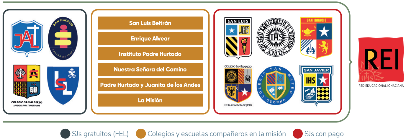
Figura 1: Área de Educación Escolar de la Compañía de Jesús en Chile.

La oficina de educación escolar, que conduce y acompaña el Área bajo el liderazgo del Delegado del Provincial, cuenta con una Secretaría ejecutiva y 4 equipos, cada uno con su dirección ejecutiva. Hay (a) un equipo de la Fundación Educacional Loyola (FEL, los 4 colegios y escuelas jesuitas gratuitos), (b) un equipo para los 6 colegios jesuitas con pago, (c) un equipo para la pastoral integral (el desarrollo espiritual, religioso y psicosocial de estudiantes, junto a temas de conviven-